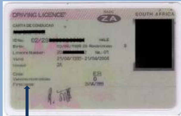
Datum van de eerste aflevering